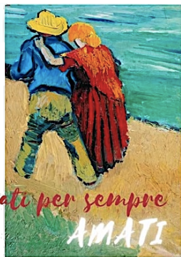
V. Van Gogh, Coppia di innamorati, Arles