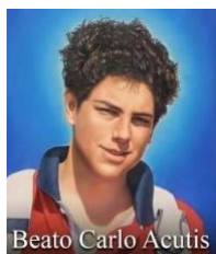
Beato Carlo Acutis