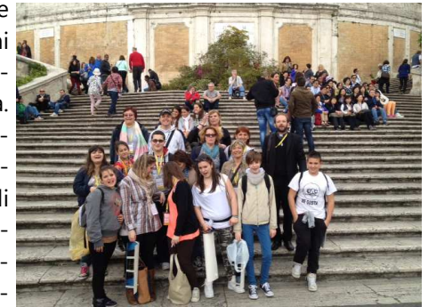
Il gruppo della nostra parrocchia sulla scalinata di Trinità dei Monti

A bbiamo oramai passato le sette ore di viaggio quando i primi palazzi della periferia della città di destinazione scorrono veloci ai lati della strada. Nonostante la stanchezza, la gioia di essere qui è molta e noi ragazzi siamo emozionati. Gemellati con le parrocchie di Santi Francesco e Chiara e della Resurrezione, è bello vedere che anche la parrocchia di Gesù Lavoratore è presente al pellegrinaggio diocesano a Roma con un bel numero di ragazzi entusiasti di essere qui, diciotto in tutto. Finalmente ci siamo: San Paolo Fuori le Mura si presenta imponente e bellissima allo stesso tempo. Qui incontriamo tutti gli altri ragazzi della diocesi e il nostro Patriarca per un incontro di benvenuto. Non mancano le domande e le provocazioni. Sono i ragazzi a porgerle.