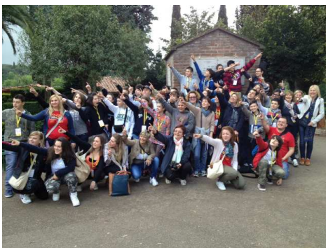
Il gruppo al completo!